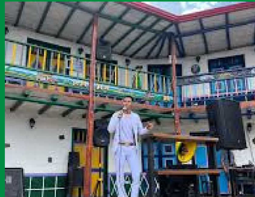
MUSICA EN VIVO